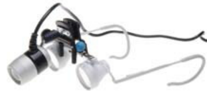
20-410 / 20-415