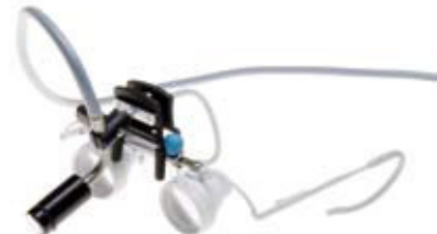
20-400 / 20-405